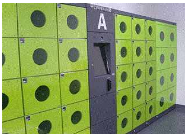
무선인터넷, 휴게실, TV시청실, 간이조리실, 체력단련실, 세탁실, 자율학습실, 편의점, 무인택배시스템, 야외 체육시설 등